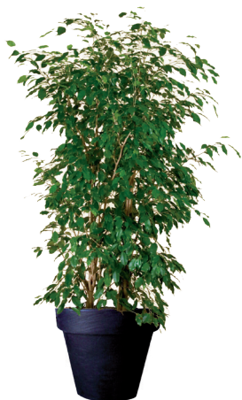
Réf. 113.160 - Ficus ht 1,80 à 2m Réf. 134.359 - Vase three noir