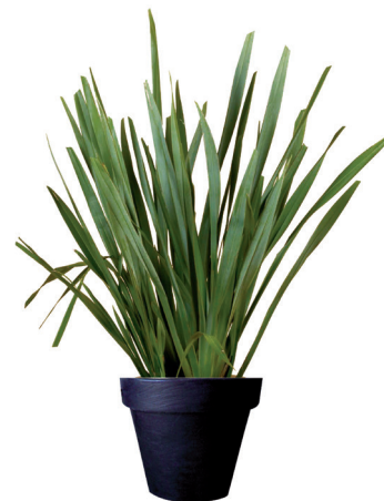
Réf. 112.300 - Phormium ht 1,20 à 1,50m Réf. 134.359 - Vase three noir