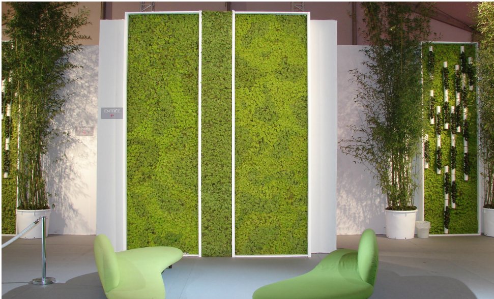
Tarifs sur devis