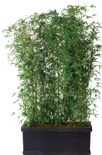
Réf. 142.960 - Bac rectangle noir 100 x 32 cm Haie de Bambous ht 2 à 2,50 m