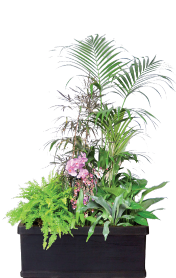
Réf. 143.200 - Bac rectangle noir 100 x 32 cm Composition de végétaux