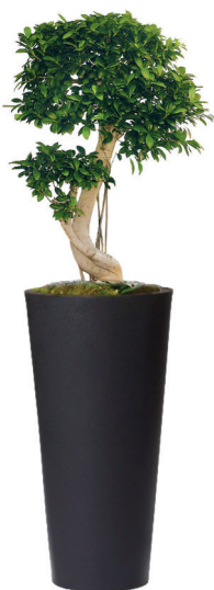
Réf. 113.410A - Bonsaï ficus nitida en bac Partner noir ht totale 1,20 à 1,50 m

No floral selection or composition is beyond the capability or creativity of our master gardeners. We guarantee to find the right arrangements for you.