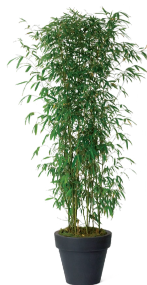
Réf. 111.110 - Bambou touffe ht 1,50 à 2 m Réf. 134.359 - Vase three noir