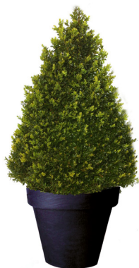
Réf. 111.140 - Buis cône Ø 50 cm ht 1 à 1,20m Réf. 134.359 - Vase three noir