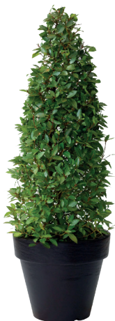
Réf. 112.135 - Laurier cône ht 1,50m Ø40/50cm Réf. 134.359 - Vase three noir

At Gally, we pride ourselves with the reputation of our presentations of both popular and exotic plant selections, presented in standard or tailor-made containers and designed to suit all tastes and decors. The objective is never to clash with or change the existing environment. Our specialists seek to create floral displays that blend with, and enhance, the beauty of the existing colour schemes and atmosphere.