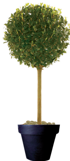
Réf. 112.160 - Laurier tige boule ht 1,80m Ø60cm Réf. 134.359 - Vase three noir