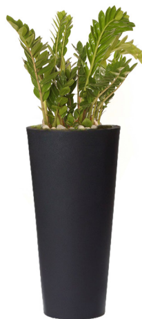
Réf. 113.410B - Zamioculcas en bac Partner noir ht totale 1,30 à 1,50 m