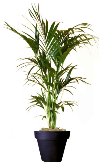
Réf. 113.200 - Kentia ht 1,80 à 2m Réf. 134.359 - Vase three noir