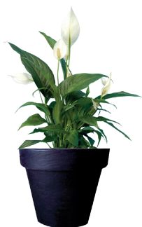
Réf. 113.310 - Spatiphyllum Sensation ht 1,20 à 1,50m Réf. 134.359 - Vase three noir