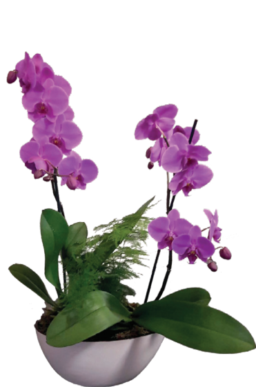
Réf. 182.200 - Coupe fleurie Ø 30 cm