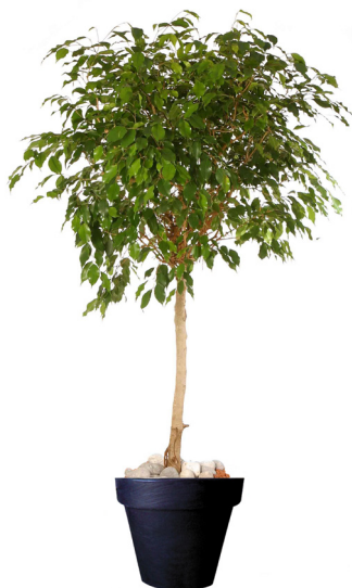
Réf. 123.220 - Ficus tige boule Ø1,20/1,50m ht 2,50 à 3m Réf. 134.359 - Vase three noir