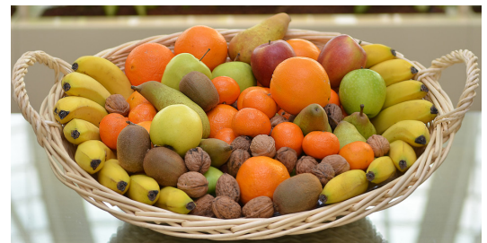
Réf. Pofruit 10K