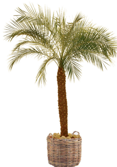
Réf. 113.230 - Phoenix roebelinii ht 1,80 à 2,10m Réf. 136.300 - Vannerie osier