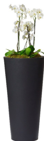
Réf. 113.410C - Orchidées en bac Partner noir ht totale 1 à 1,10 m