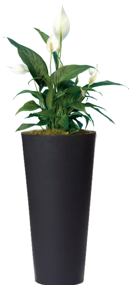
Réf. 113.300A - Spatiphyllum sensation en bac Partner noir ht 1,80 à 2 m