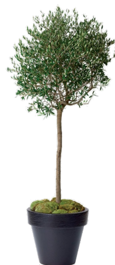
Réf. 112.020 - Olivier Réf. 134.359 - Vase three noir