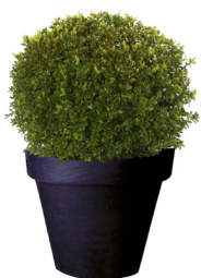
Réf. 111.125 - Buis boule Ø 35/40 cm ht 0,50m Réf. 134.359 - Vase three noir