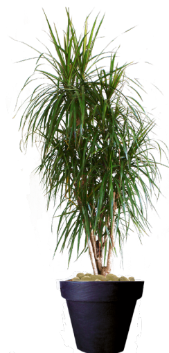
Réf. 113.130 - Dracaena maginata ht 1,80 à 2m Réf. 134.359 - Vase three noir