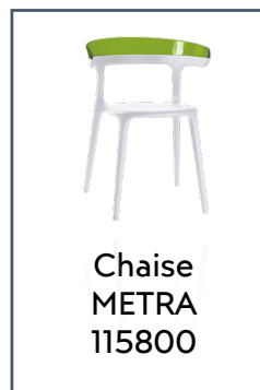
Chaise METRA 115800