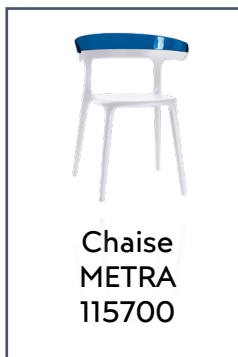
Chaise METRA 115700