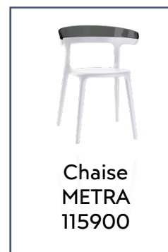
Chaise METRA 115900