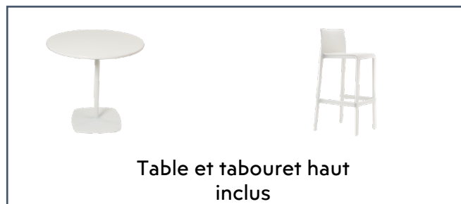
Table et tabouret haut inclus